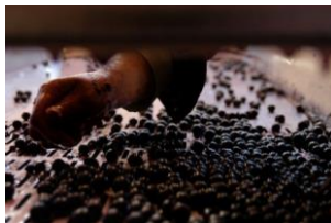
Sortiertisch – hohes Qualitätsniveau