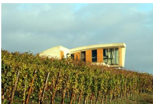
Weingut Ruppert im Weinberg