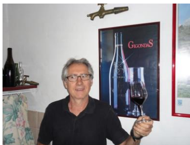
Claude bei der Gigondasverkostung

Die Domaine Notre Dame de Pallières ist eine der stillen Domänen in der südlichen Rhône. Sie produzieren hier Weine mit der Klassifizierung “Côtes du Rhône Villages”: Sablet, Rasteau und Gigondas. Sie gelten als die “stillen Stars der Appelation”. Die Familie ist schon seit Jahrhunderten auf dem Weingut ansässig. Der Name des Weingutes “Notre Dame” rührt von der Zeit der Gründung des Stammklosters in Prébayon im Jahre 1145 durch den weiblichen Orden der Kartäuserinnen direkt in der Nähe. Hier gibt es Dokumente bezüglich geregelter Wegerechte zwischen der Familie Roux und den Nonnen.